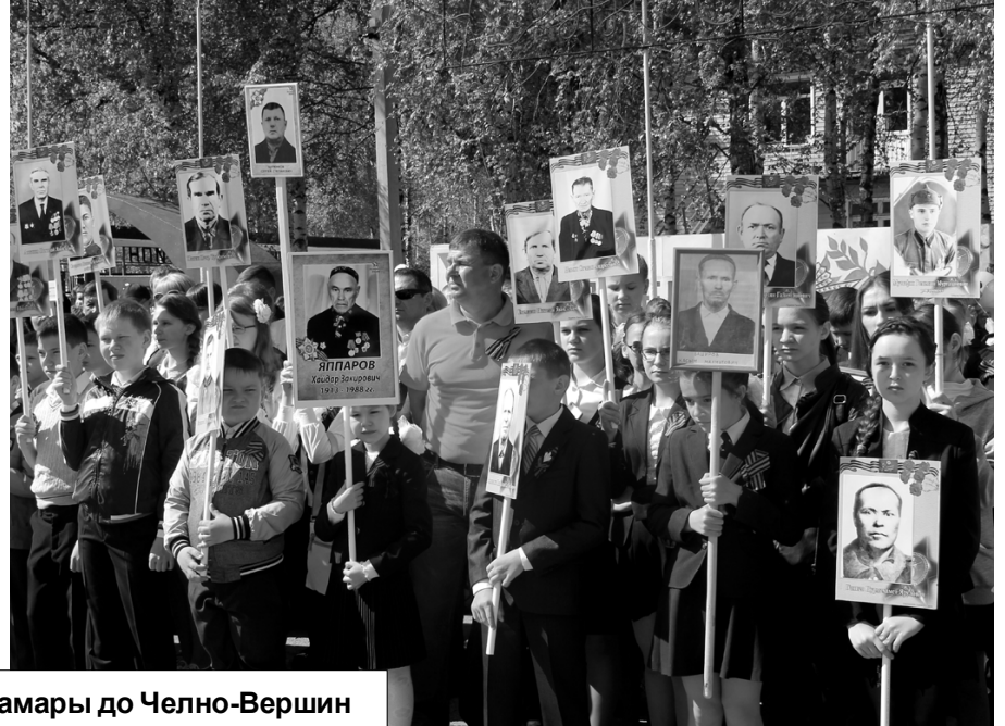
«Бессмертный полк»: от Самары до Челно-Вершин

В этом году по инициативе губернатора торжества с 4 по 9 мая проводились с особым масштабом, чтобы жители даже самых удалённых уголков области смогли принять в них участие. Почти миллион жителей области стали активными участниками праздничных событий, из них 225 тысяч – в Самаре.